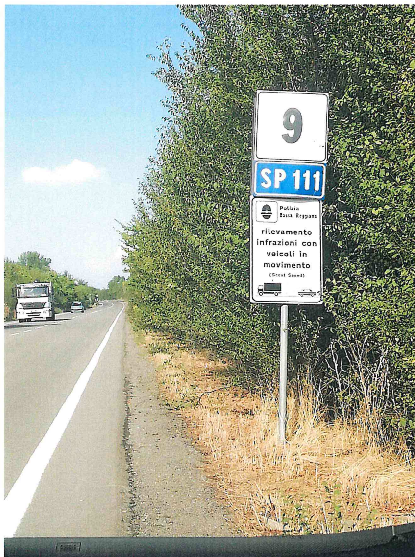
4. SP 111 KM 9+000 DIR. POVIGLIO