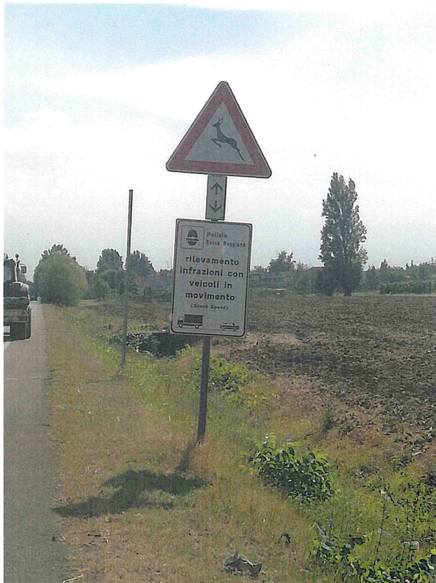
3. SP 111 INT. VIA GRUARA DIR. GATTATICO