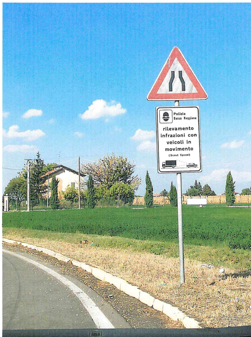
1. SP 111 KM 13+600 DIR. BORETTO